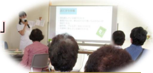
前回サロン(7/16)の様子